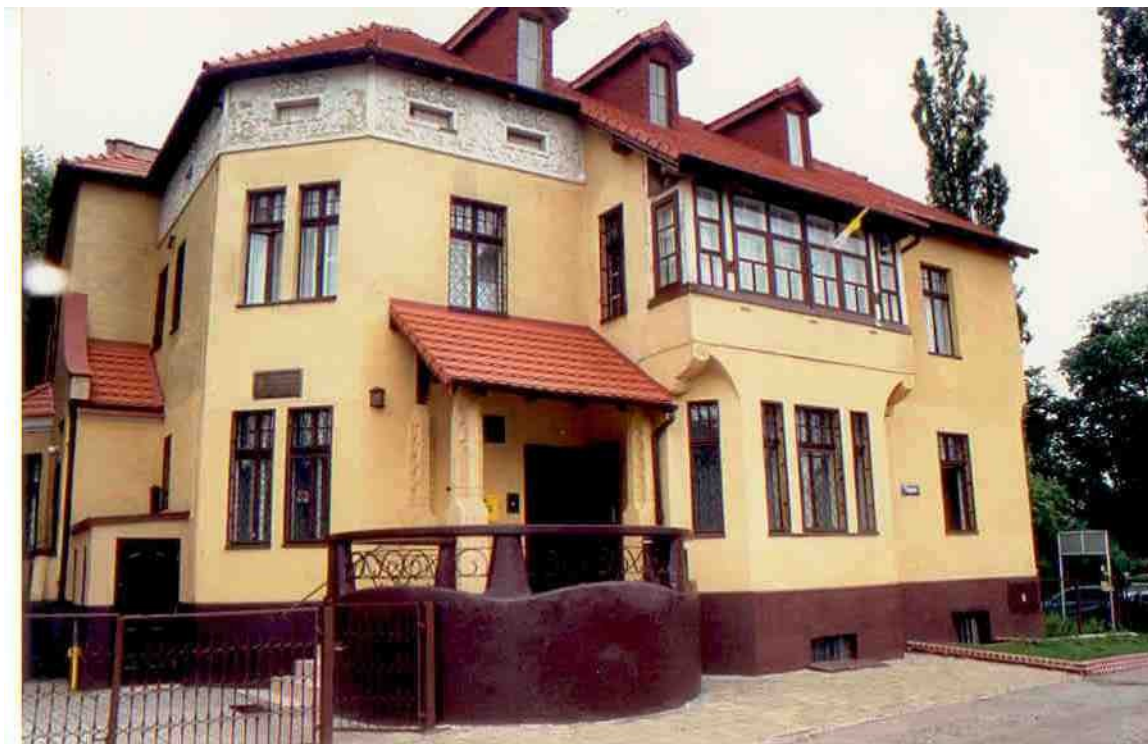
Budynek KPOIL przy ul. Chopina 20, w którym w latach 1990-2013 mieścił się Oddział GBL w Toruniu